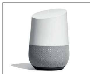
Abb.: Google Home