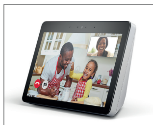
Abb.: Amazon Echo 8, Quelle: Presse-Kit Amazon