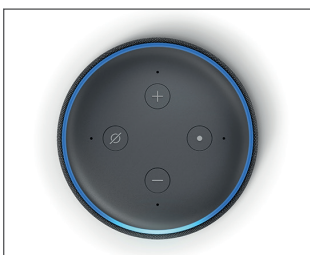
Abb.: Amazon Echo Dot, Quelle: Presse-Kit Amazon

Als Smart Speaker wird ein Lautsprecher bezeichnet, der als Hardware dient und auf dem ein beliebiger Sprachassistent zum Einsatz kommt.